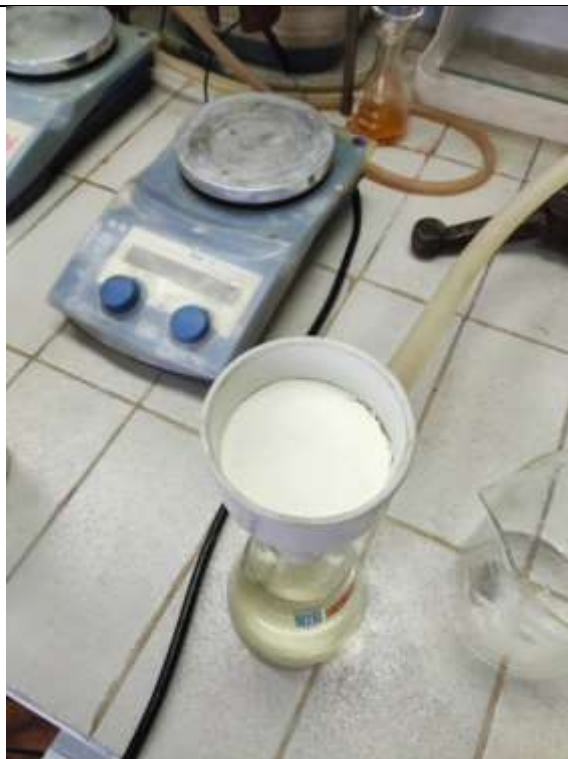
beli talog p -bromacetanilida