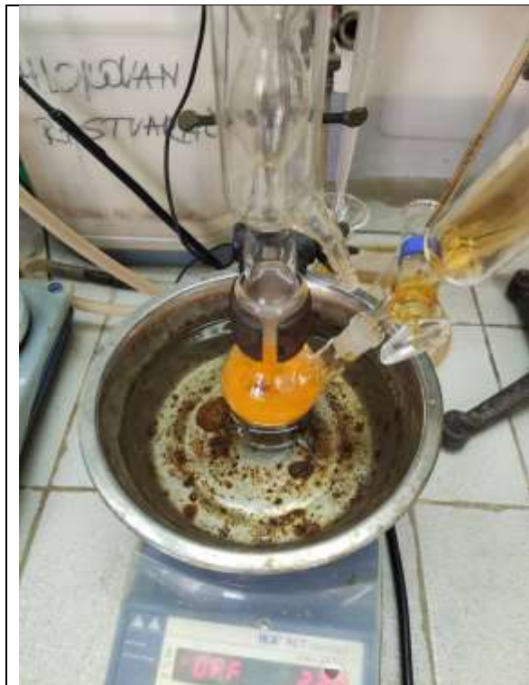
Aparatura za bromovanje acetanilidi

U dvogrli balon od 100 ml, opremljen povratnim kondenzatorom i kapalicom, pripremiti rastvor koji sadrži acetanilid (6,8 g, 0,05 mol) i sirćetnu kiselinu (22,5 ml). U kapalicu sipati posebno pripremljen rastvor broma (8,5 g, 2,65 ml, 0,053 mol) u sirćetnoj kiselini (12,5 ml), i ukapati u rastvor acetanilida uz mešanje magnetnom mešalicom i hlađenjem na vodenom kupatilu. Nakon dodatka celokupne količine broma, boja broma iščezava. Smeša se ostavi da stoji 20 minuta na sobnoj temperaturi, zatim se izlije u 200 ml hladne vode, a balon se ispere sa 100 ml vode. Dobijeni talog n -bromacetanilida se procedi na Buchner-ovom levku. Sirovi proizvod se prenese u balon okruglog dna od 250 ml, opremljen povratnim kondenzatorom. Talog se rastvori u minimalnoj količini ključalog etanola (~40 ml), a potom se u smesu kroz kondenzator doda ista zapremina vode. Hlađenjem nastaje beli talog p -bromacetanilida koj se procedi na Buchner-ovom levku, ispere hladnom vodom i osuši na vazduhu. Dobija se p -bromacetanilid u obliku belih kristala, koji se tope na 166 °C, u prinosu od 70-80%.