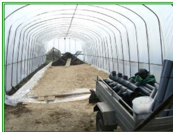
Izgradnja HALDE u RNP

Bioremedijacija zemljišta zagadjenog naftom i naftnim derivatima je savremena i ekonomična metoda, koja zadovoljava sve uslove "green technology". Sposobnost prirodno prisutnih mikroorganizama za degradaciju nafte je testirana u laboratorijskim uslovima. Nakon dobijanja povoljnih rezultata u odnosu na razgradnju ugljovodonika i njihovih derivata (bioremedijacioni potencijal), mikrobnog konzorcijum je izolovan, a iz njega je izvršena selekcija i adaptacija zimogenih mikroorganizama, koji razgrađuju ugljovodonike nafte. Biomasa velike gustine aktiviranih mikroorganizama je jedanput nedeljno aplicirana na eksperimentalnu haldu. U krugu Rafinerije nafte Pančevo na vodonepropusnoj podlozi od zemljišta različitog nivoa kontaminacije naftom i naftnim derivatima izradjena je bioremedijaciona halda (otvoreni bioreaktor) zapremine 150 m 3 . Biostimulacijom, bioventilacijom i reinokulacijom autohtonog mikrobnog konzorcijuma za oko pet meseci, postignuta je razgradnja ukupnih ugljovodonika nafte od početnih skoro 30 do oko 3 g/kg suvog zemljišta odnosno efikasnost bioremedijacije je približno 90 %. Rezultati ovog Projekta potvrđuju da je bioremedijacija bio(geo)tehnološki postupak, kojim se dobija reciklirano zemljište. Dakle, ne dobija se bezopasan otpad koji može da se odloži na deponiju, već zemljište, koje ima upotrebnost.